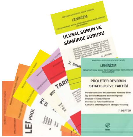
Marksizm-Leninizm Küçük Kitaplığı LENİNİZM